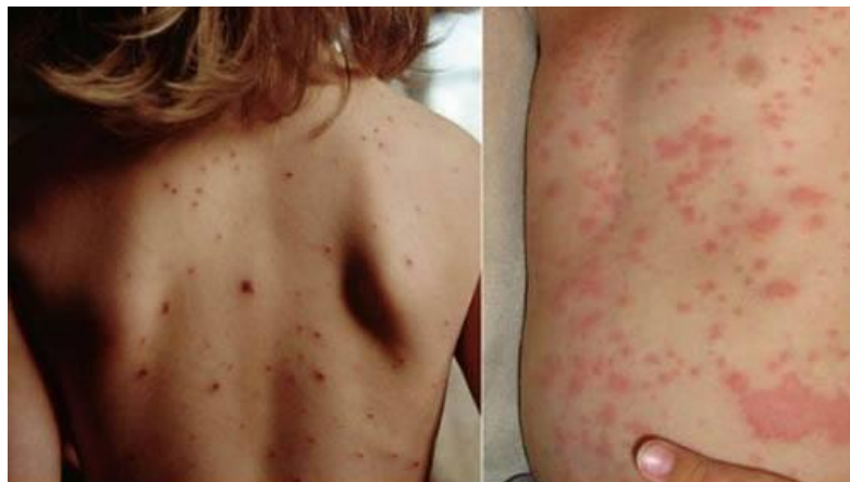
Атипичная форма кори

Как проявляется корь: фото детей с высыпанием Корь можно отличить от других болезней по характеру протекания. Вначале появляется температура до 39 градусов, затем краснеют, начинают слезиться и гноиться глаза.