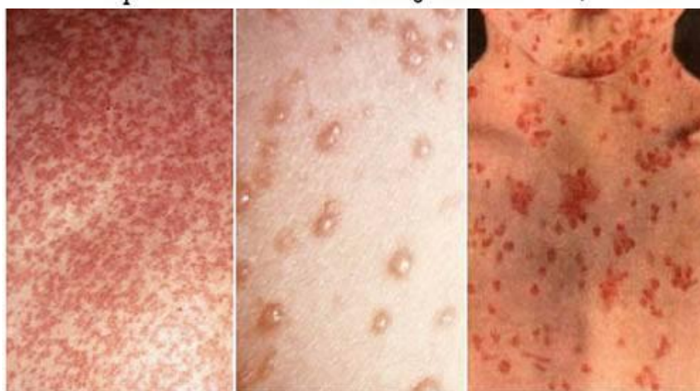
Сыпь при краснухе